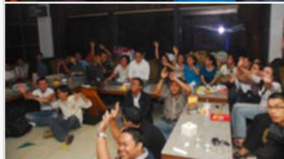
PT. Teledata Indonesia menggelar acara kebersamaan bagi seluruh