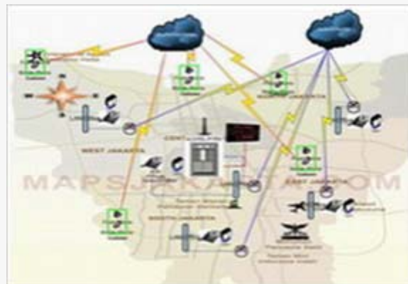
Distributed Contact Center Overview

Distributed Contact Center atau bisa juga disebut dengan Contact Center terdistribusi.